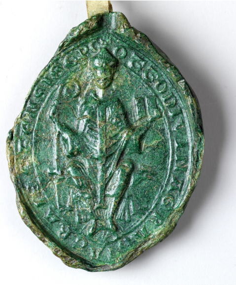
Zegel van bisschop Otto uit 1226.

Ook in het bisdom Utrecht werd gepredikt en bisschop Otto besloot in 1217 samen met een aanzienlijk aantal ministerialen op kruistocht te gaan. In totaal trokken onder leiding van de Hollandse graaf Willem I zo'n vier- tot vijfduizend mensen uit onze streken naar Jeruzalem. Vanuit de stad Utrecht vertrok een onbekend aantal schepen met banieren met daarop de beschermheilige van de stad, Sint Maarten 18 . Ze voegden zich bij de legers uit tal van andere Europese landen. Na schermutselingen in Palestina, trok het kruisvaardersleger naar Damiate in Egypte. Maar Otto had zijn buik er al vol van en maakte rechtsomkeert. Eind 1218 was hij weer terug in Utrecht, na een afwezigheid van anderhalf jaar 19 . De kruistocht liep uit op een fiasco.