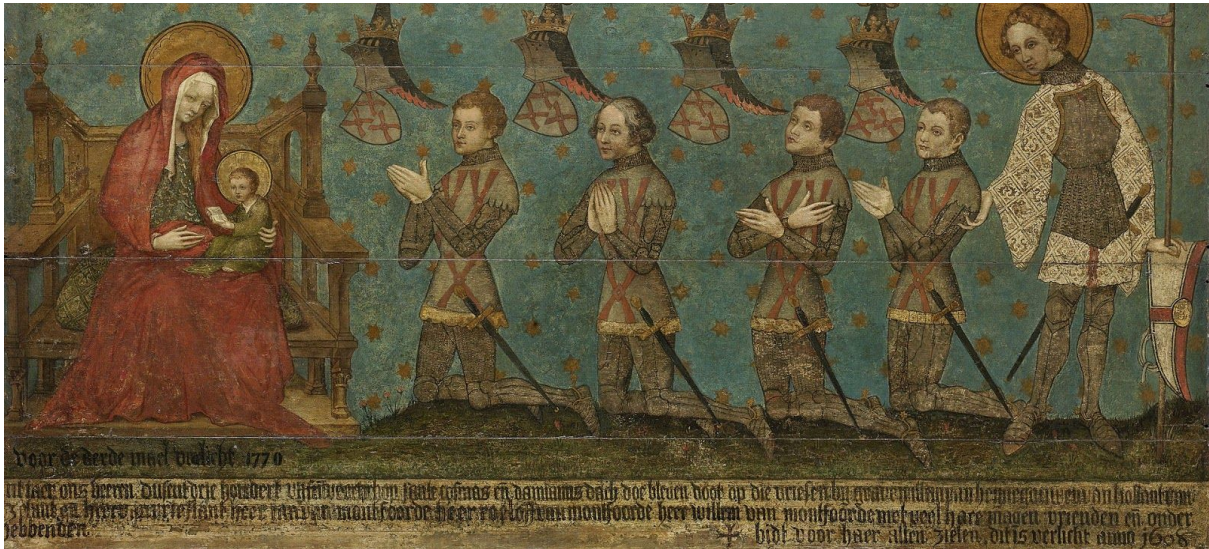
Memorietafel van de heren van Montfoort, Utrecht ca. 1400 (Rijksmuseum Amsterdam). Omgekomen samen met Graaf Willem IV in de oorlog tegen de Friezen in 1345.

Tijdens de zomer van 1345 trekken donkere wolken samen boven de stad Utrecht. Graaf Willem IV van Holland, Zeeland en Henegouwen belegert met een groot ridderleger 1 de stad. Met blijden worden enorme rotsblokken over de stadswal geslingerd. Zo'n zes weken houdt Utrecht stand, maar uiteindelijk geeft de stad zich over en smeken de Utrechters om vergiffenis.